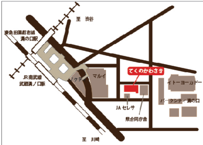
川崎市生活文化会館てくのかわさき

川崎市高津区溝口1-6-10 044-812-1090 JR南武線「武蔵溝ノ口駅」・東急田園都市線「溝の口」駅から徒歩 5分