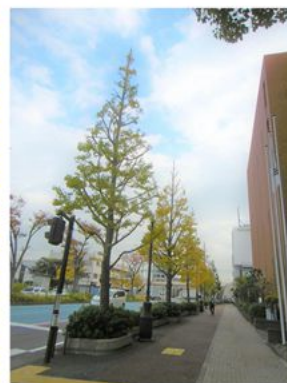
会館前 11月中旬のイチョウ

6月号で掲載した新緑のイチョウが色づき始め、晩秋の風景を愛でる楽しさが広がっています。30年程前の11月初旬、連休のTVニュースで神宮外苑のイチョウ並木が鮮やかな黄色一色に染まり、沿道では『東京バザール』が賑やかに開催されていたことを思い出しました。温暖化の影響でしょうか、当時と紅葉の時期が1か月近くずれているようです。季節の挨拶で「晩秋の候」は10月8日頃～11月7日頃迄、現在は、まだ、暖かいといふか暑い日も多く、この季節を用いるのは、悩むと同時に難しさも感じられる昨今となりました。