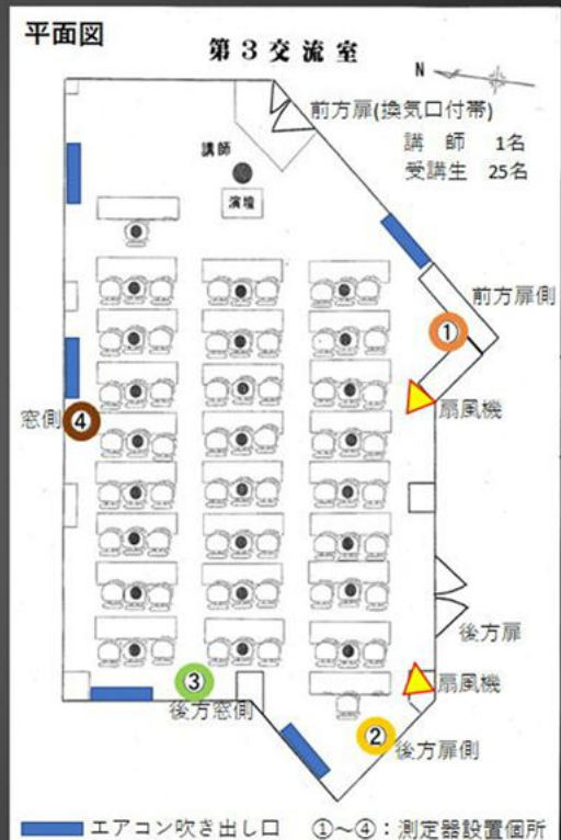
①前方扉側 ②後方扉側 ③後方窓側 ④窓側