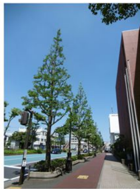
会館前 5月のイチョウ