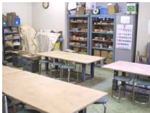
陶芸実習室(定員16名)